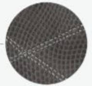
Hochwertiges Rindsleder in doppellagiger Verarbeitung